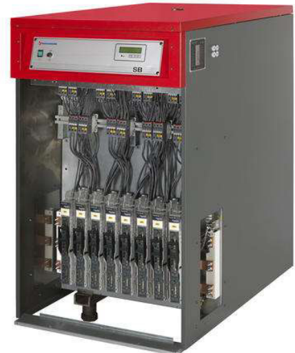
Bilde viser SB 600kW/400V

Kjelen er forberedt for fjernstyring med 0 - 10 V(4- 20 mA) Og kan styres enten på temperatur eller effekt. Eksternt start/stopp-signal samt drift-/feilsignal ligger ferdig koblet koblet til rekkeklemmelist i kjelen. I tillegg kan innstilt temperatur/virkelig temperatur og innkoblet effekt(0 – 10 V signal) hentes ut.