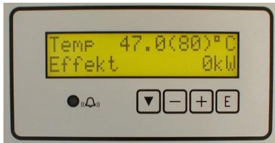
30-trinns elektronisk regulator med mulighet for fjernstyring

Kjelen leveres i størrelser 375 kW/230 V, og fra 375 – 600 kW for 400 V/690 V. Driftstemperatur er maks. 95 °C og driftstrykk maks. 6/16 bar. Kjelen er utstyrt med en elektronisk temperaturregulator i 30 trinn med temperaturområde fra 30 – 95 °C. Regulatoren har display for indikering av bl.a. temperatur, innkoblet effekt, antall innkoblede trinn osv.