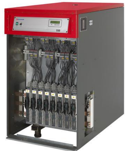
Bilde viser SB 600kW/400V

Kjelen er forberedt for fjernstyring med 0 - 10 V(4- 20 mA) Og kan styres enten på temperatur eller effekt. Eksternt start/stopp-signal samt drift-/feilsignal ligger ferdig koblet koblet til rekkeklemmelist i kjelen. I tillegg kan innstilt temperatur/virkelig temperatur og innkoblet effekt(0 – 10 V signal) hentes ut.