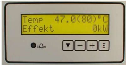
30-trinns elektronisk regulator med mulighet for fjernstyring

Kjelen leveres i størrelser 375/230V, og fra 375 - 600kW For 400V/690V. Driftstemperatur er maks. 95 °C og driftstrykk maks. 6/16bar. Kjelen er utstyrt med en elektronisk temperaturregulator i 30 trinn med temperaturområde fra 30 – 95 °C. Regulatoren har display for indikering av bl.a. temperatur, innkoblet effekt, antall innkoblede trinn osv.